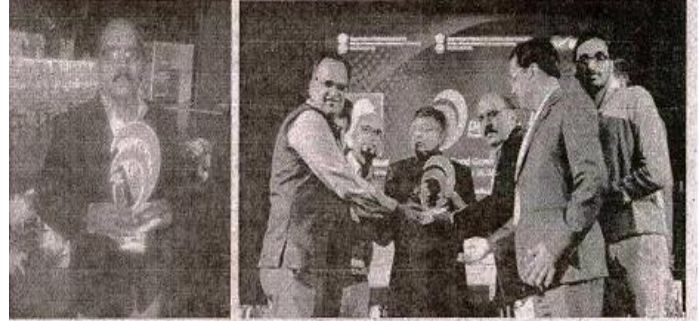
जिले को मिला पुरस्कार, दूसरा चित्र में जिला सूचना अधिकारी पुरस्कार प्राप्त करते हुए।